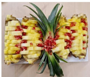
Ananas en granaatappel

In deze Handdruk leest u o.a. meer over: