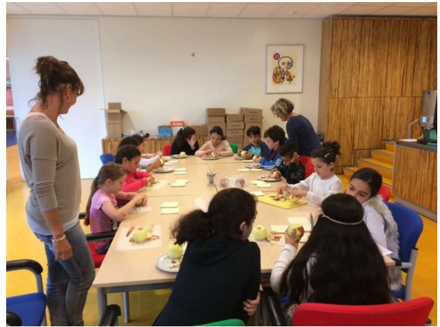
↑ De kinderen maken hun eigen appelbeignets (ook wel bekend als de appelflap!)