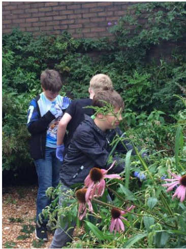
Samen werken in de patio-tuin. ↑