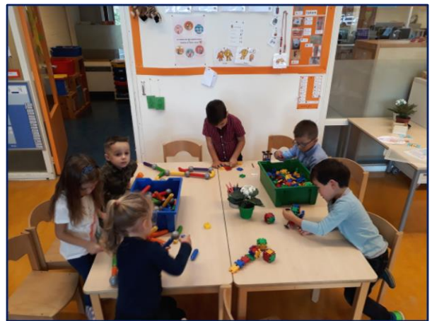
De kleuters zijn weer enthousiast aan het werk.

De schoolgids voor dit jaar is te vinden op de website van De Griffel: www.bsdegriffel.nl