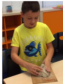
← Hier wordt gewerkt met karton en klei.